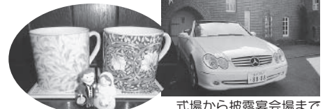
式場から披露宴会場まで

〒921-8032 石川県金沢市清川町2-6 TEL : 076-226-8850 FAX : 076-226-8852 http://www.morris-church.com/